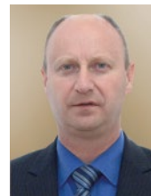
župan Željko Kolar

Društvo u cjelini razvijeno je onoliko koliko je razvijeno civilno društvo, stoga se nadamo da će ova strategija dovesti do daljnjeg razvoja civilnog sektora i jačanja postojećih kapaciteta kako bi organizacije civilnog društva bile ravnopravni nositelji društvenog razvoja.